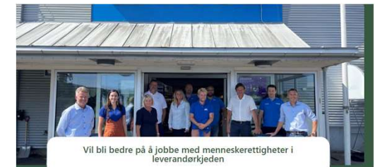
Vil bli bedre på å jobbe med menneskerettigheter i leverandørkjeden

For å nå våre bærekraftsmål, og for å kunne hjelpe våre kunder med å nå sine, må vi se på leverandørkjeden vår. Ved å være tydelige på sosiale og miljømessige krav på innkjøpsstadiet, sørger vi for at bærekraftspørsmål står på dagsordenen helt fra starten av.