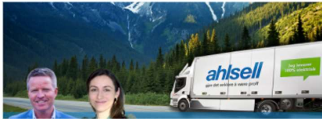
Nå fylles de første lastebilene våre med biodrivstoff: Ny milepæl i Ahlsells satsing på utslippskutt