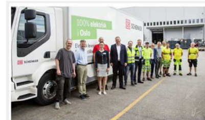
Nådde målet om å kutte 70 prosent utslipp

Nå går en samlet logistikkbransje i bresjen for å sikre at biogass blir allment tilgjengelig som lastebil drivstoff. NHO har invitert inn hele verdikjeden til samarbeid, og Ahlsell er stort prosjekter for biogassprosjektet i Grønt landtransportprogram.