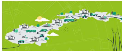
Ahlsell i front når samlet logistikkbransje krever at biogass kommer på plass